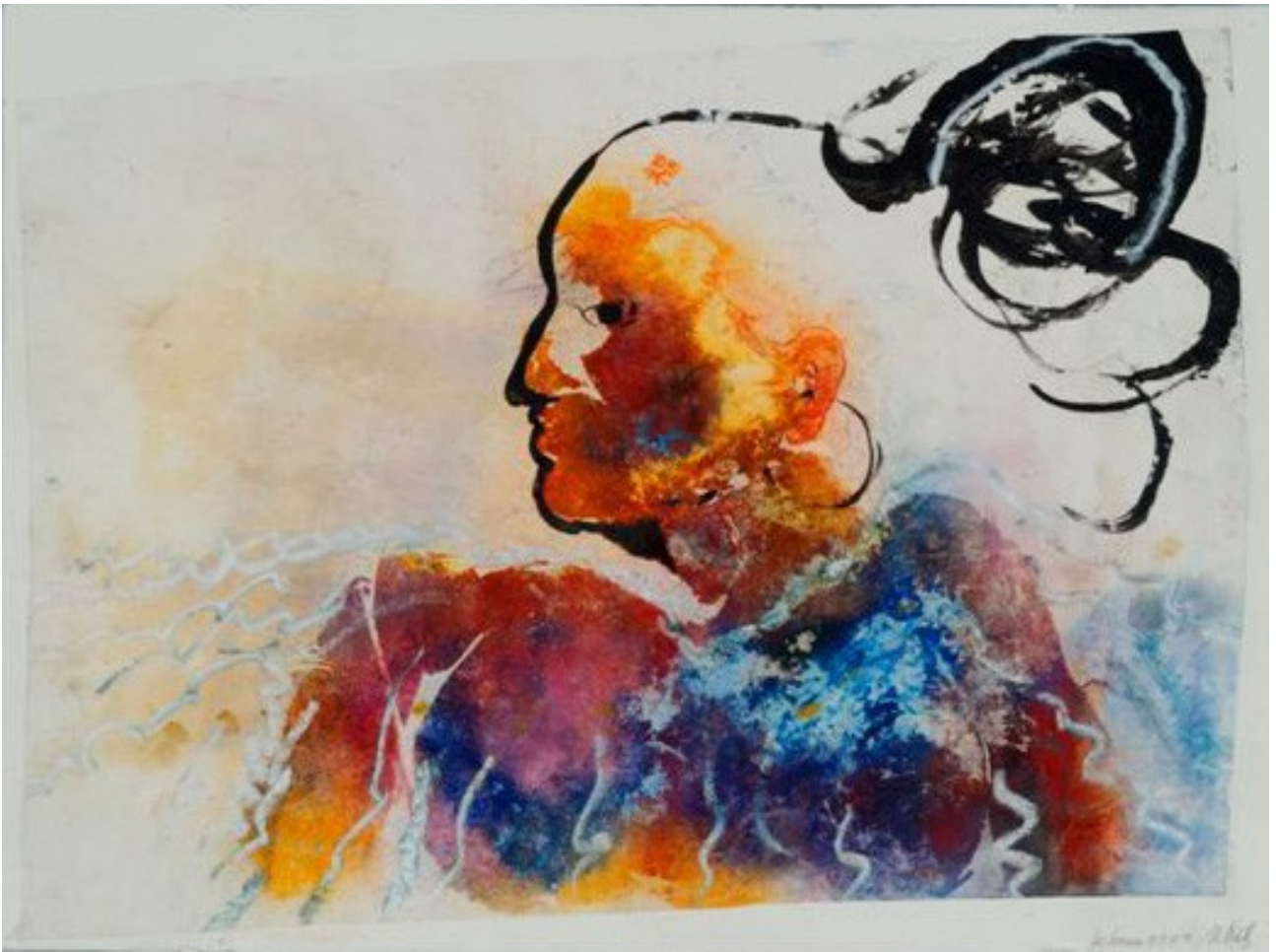
Mariée aux cheveux blancs 2003 peinture sur papier 55 x 76 cm 1600 EUR