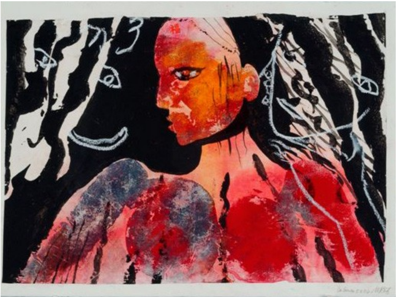
Mariée espagnole 2003 peinture sur papier 55 x 76 cm 1600 EUR