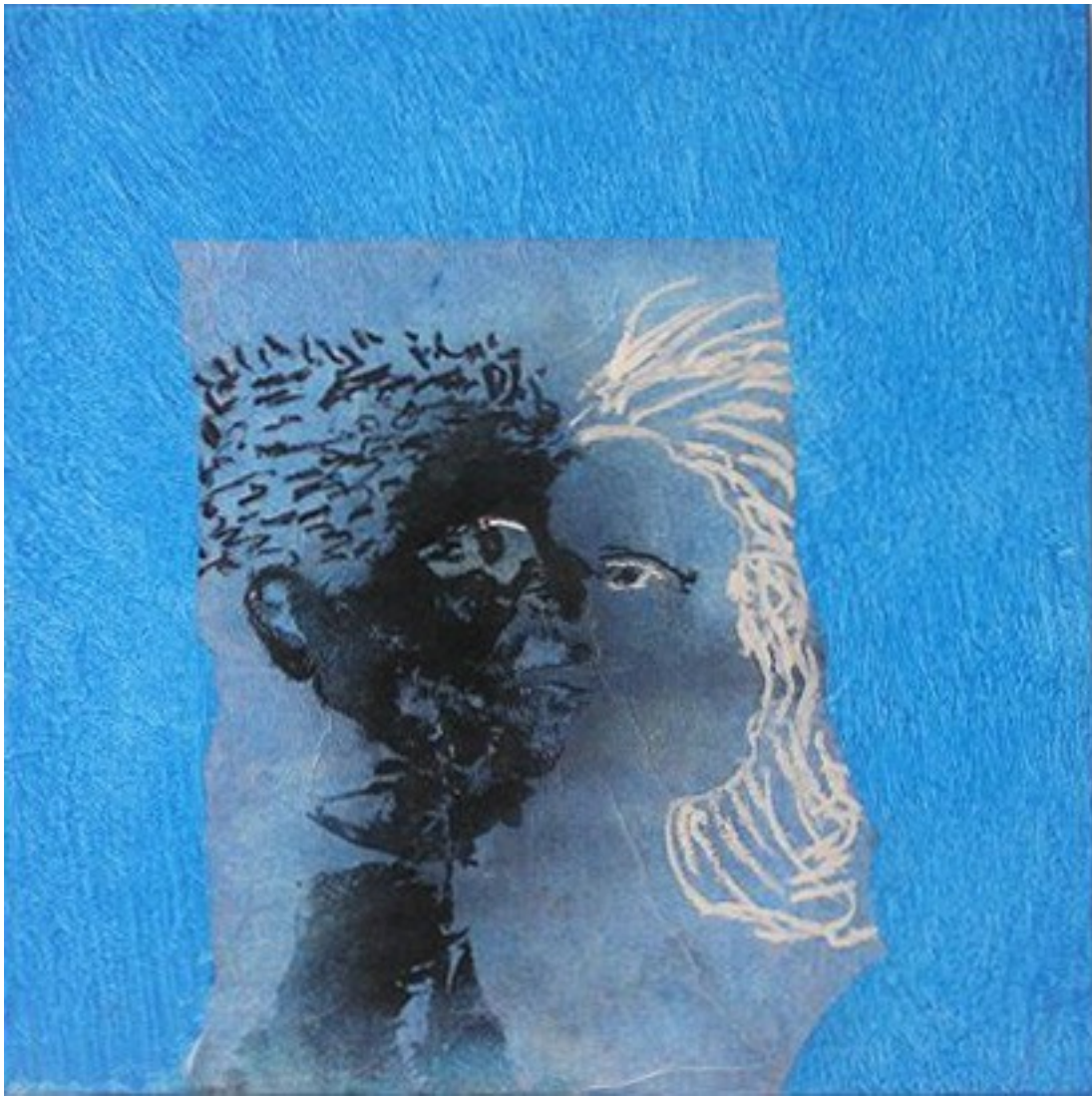
Le baiser 2004-2005 peinture sur toile 60 x 60 cm 1800 EUR