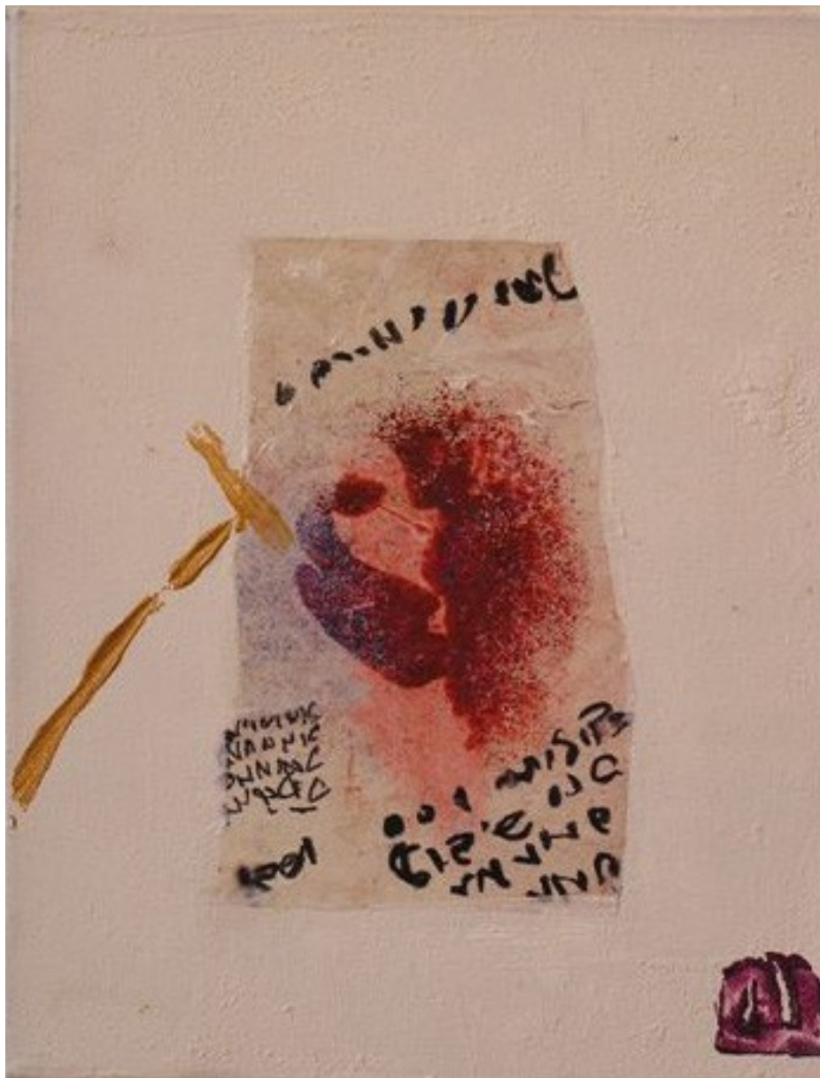
Les petites oreilles 03 2005 peinture sur toile 24 x 19 cm 850 EUR