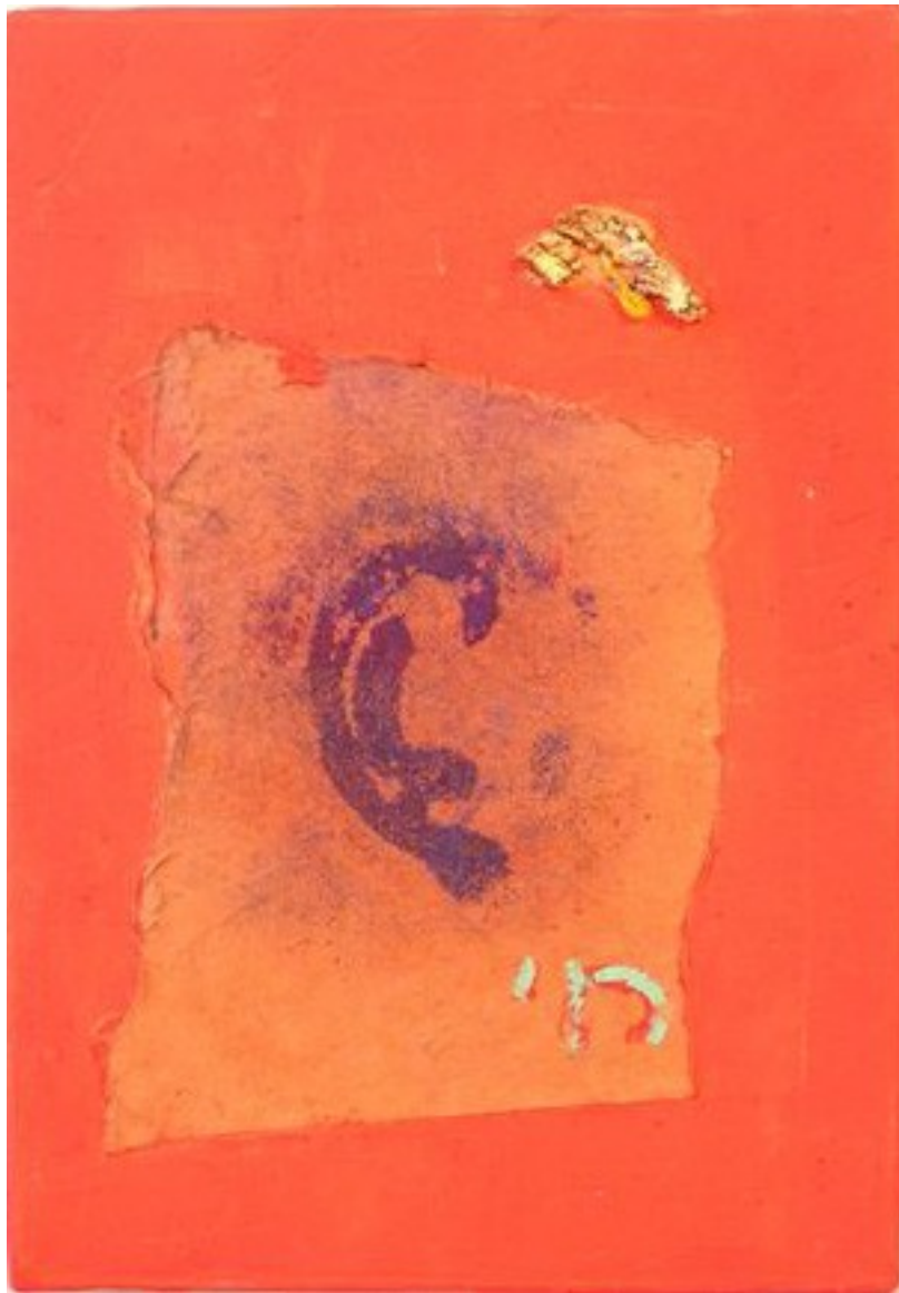
Les petites oreilles 01 2005 peinture sur toile 24 x 19 cm 850 EUR