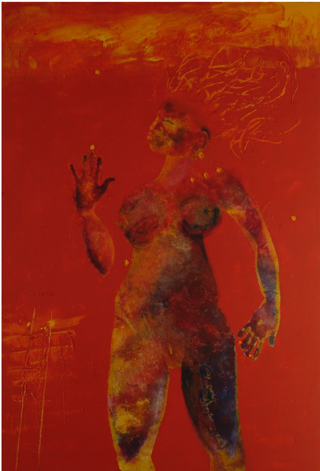
La jongleuse d'étincelles 2001 huile sur toile 162 x 114 cm 4500 EUR