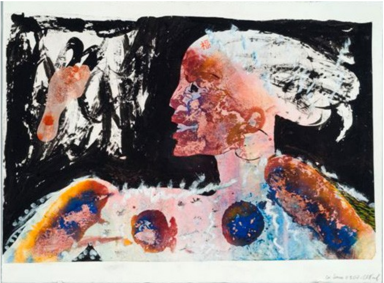
Mariée avec pied fond noir 2003 peinture sur papier 55 x 76 cm 1600 EUR