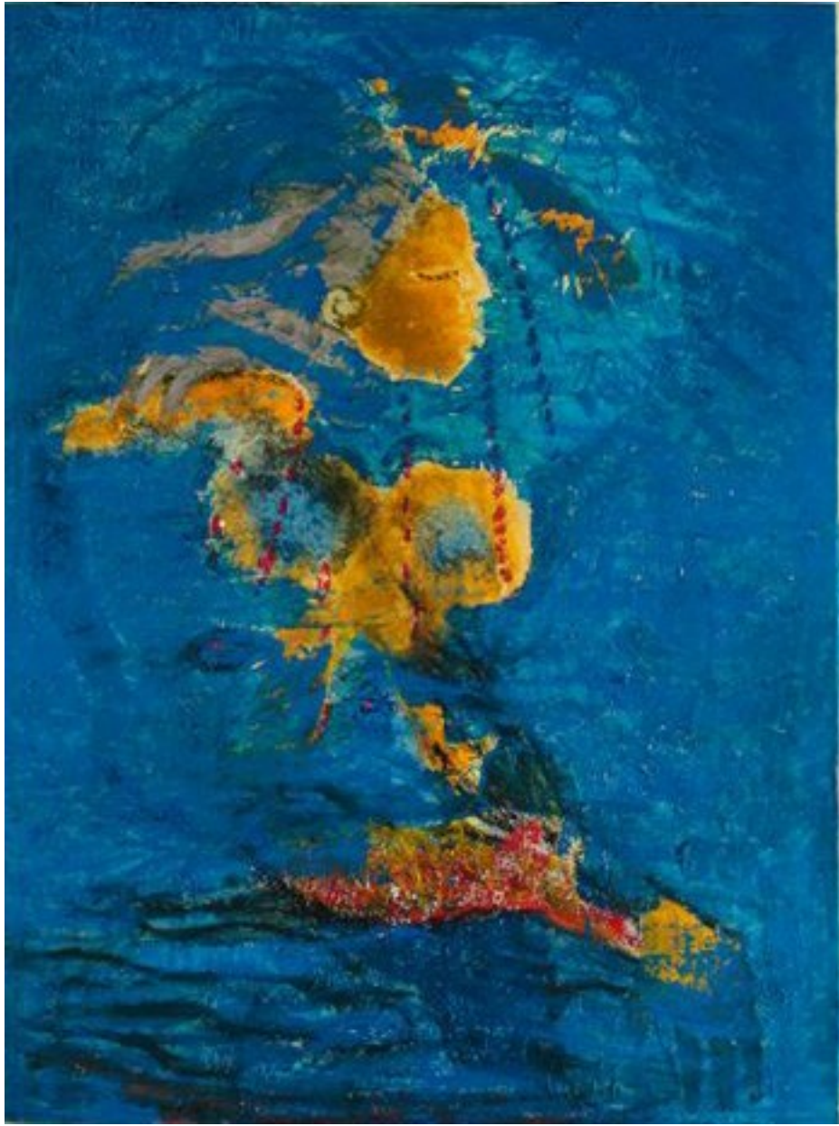
Dame nage 2004

Huile sur papier marouflé sur toile, peinture à la cire d'abeille 130 x 97 cm 4500 EUR